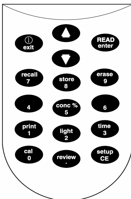
表 1 按键及功能